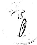
Luiz Tadeu Leite Prefeito Municipal