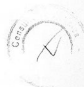
Luiz Tadeu Leite Prefeito Municipal